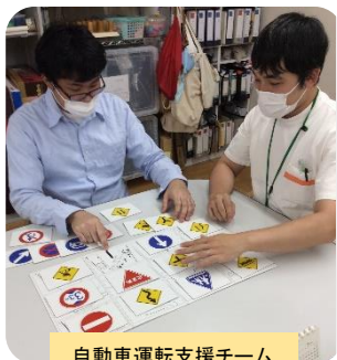
自動車運転支援チーム