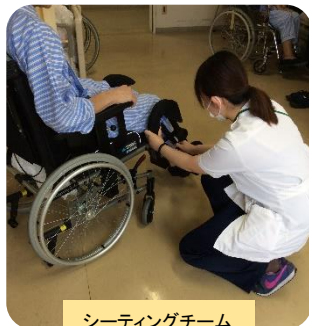
シーティングチーム