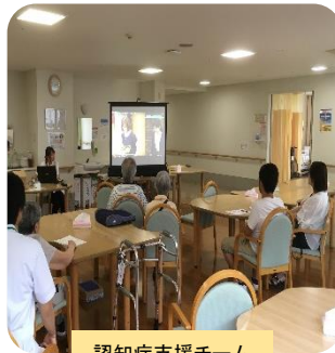
認知症支援チーム